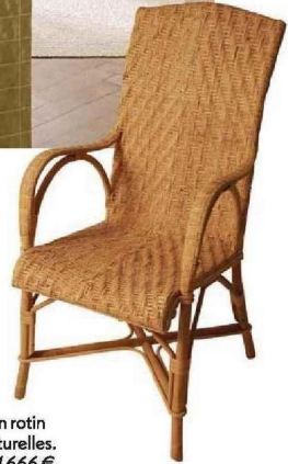
Fauteuil en rotin et fibres naturelles. À partir de 1666 €, Maison Louis Drucker.