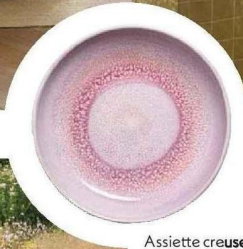
Assiette creuse en céramique rose minéral (23 cm). 24 €, Céladon.