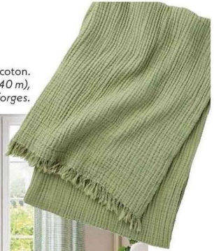
Plaid en gaze de coton. Cyclades (2 x 1,40 m), 99 €, Desforges.