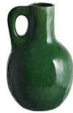
Pichet en grès (25,5 x 16,5 cm). 19,99 €, Monoprix.