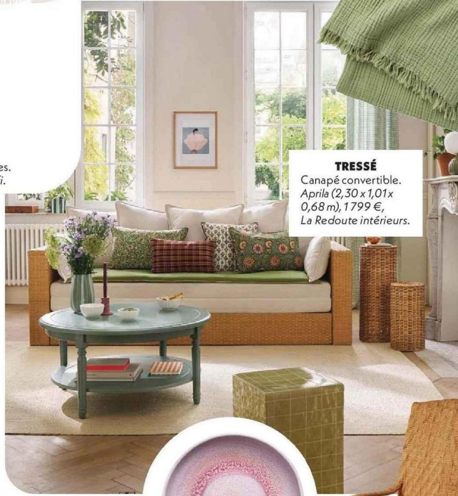
Canapé convertible. Aprila (2,30 x 1,01 x 0,68 m), 1799 €, La Redoute intérieurs.