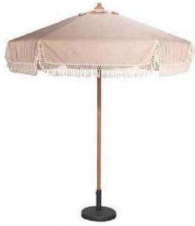
Parasol à franges. Bali, 39 €, Gifi.